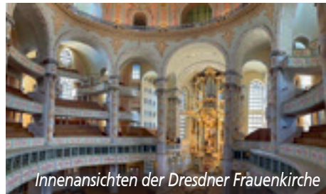
Innenansichten der Dresdner Frauenkirche