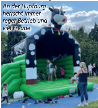
An der Hüpfburg herrscht immer reger Betrieb und viel Freude