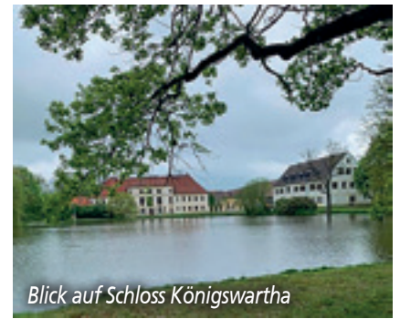
Blick auf Schloss Königswartha