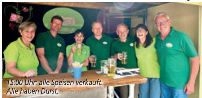
15:00 Uhr: alle Speisen verkauft. Alle haben Durst.