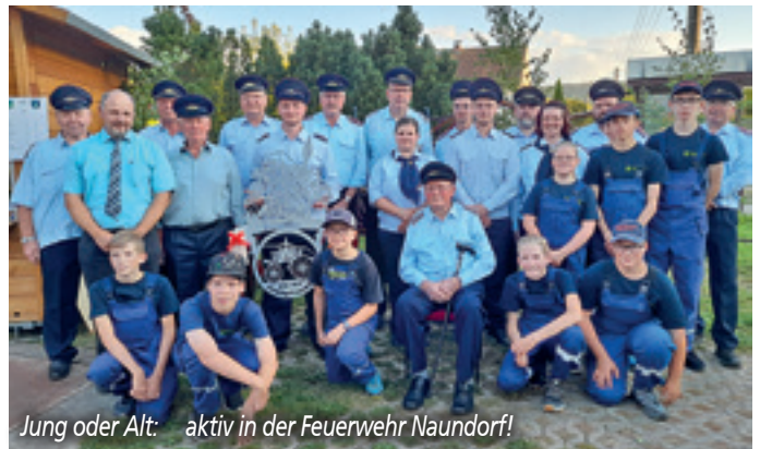
Jung oder Alt: aktiv in der Feuerwehr Naundorf!

Unsere gute Nachwuchsarbeit in der Jugendfeuerwehr bildet derzeit 15 Kinder und Jugendliche aus. Wir brauchen aber viele und auch weitere neue Hände in allen Ortswehren, um die Aufgaben einer Wehr zu stemmen. Egal ob Mann oder Frau. Haben Sie schon mal nachgedacht hier Ihren Beitrag für unsere Gemeinschaft zu leisten? Schauen Sie doch mal in den Ortswehren vorbei. Wegzüge, Gesundheits- oder Altersabgänge sowie Rückgänge bei den aktiven Kameraden machen es nötig, die Reihen immer wieder aufzufüllen und zu ergänzen. Aktuell 46 Mitglieder der Alters- und Ehrenabteilung der Feuerwehr haben ihren Beitrag in der Vergangenheit geleistet und vertrauen nun auf die nächsten Generationen, die es ihnen gleich tun.