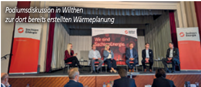
Podiumsdiskussion in Wilthen zur dort bereits erstellten Wärmeplanung

Durch das Gremium des Abwasserzweckbandes Bautzen konnte ein weiterer wichtiger Schritt im Tiefbau erzielt werden. Hier wurde von den anderen Verbandsgemeinden beschlossen, zukünftig die Abwässer von der Kläranlage Gaußig aufzunehmen. Die dafür notwendige Vermessung und Feinplanung der Trasse wurden begonnen und erste Ergebnisse bereits abgestimmt. Um die Wasserburg in Drauschkowitz wurde bereits die Abwasserdruckleitung im Zuge der Erneuerung des Teilortskanals mit nötiger Deckensanierung der Straße verlegt. Der geplante Bauabschluss 2024 konnte leider nicht gehalten werden. Durch eine zusätzliche Isolierung der nötigen provisorischen Trinkwasserleitung musste der Bau aus Kostengründen über den Winter ausgesetzt werden. Insgesamt kostete diese notwendige Maßnahme nahezu 0,5 Mio. Euro, die es über unseren Haushalt zu finanzieren galt.