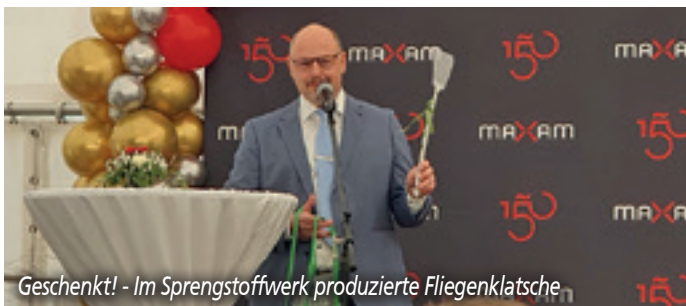
Geschenkt! - Im Sprengstoffwerk produzierte Fliegenklatsche

konnte auf seine im Berg- und Tunnelbau oder als Lawinsprengstoff in den Alpen unverzichtbaren Produkte verweisen, die in der Vergangenheit und hoffentlich noch weit in die Zukunft gute Geschäfte und sichere Arbeitsplätze in unserer Gemeinde bedeuten. Aber auch die historische Geschichte des Werkes wies Höhen und Tiefen auf, wie in der dicken Chronik des Werkes neu niedergeschrieben wurde. So wurden zeitweise sogenannte Konsumgüter produziert wie Feuerwerksraketen, Maschendraht, Fenster oder Spielzeugeisenbahnen. Eines dieser durchaus „gefährlichen“ Konsumgüter konnte ich zur Jubiläumsfeier unserem Ministerpräsidenten überreichen – eine Fliegenklatsche aus Gnaschwitz!