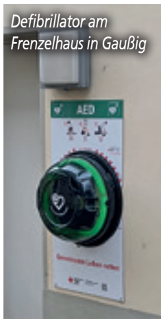
Defibrillator am Frenzelhaus in Gaußig

Sicher habe ich in meinem Jahresrückblick so einiges und einige vergessen zu erwähnen. Sei es auf Grund der Fülle an Themen oder dass manches einfach zum Glück still und geräuschlos im Hintergrund abläuft. Da fällt mir insbesondere die angeschobene Digitalisierung des Straßennetzes und die Bearbeitung von Straßenwidmungen ein, aber auch der Bauhof, die Bürger oder Geschäftstreibenden, die sich 2024 mit den notwendigen Straßensperungen arrangieren mussten!