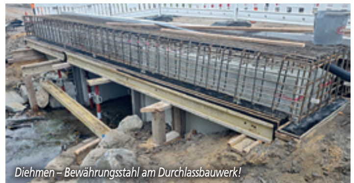
Diehmen – Bewehrungsstahl am Durchlassbauwerk!

Da die Gemeinde für den Freistaat die Federführung beim Gemeinschaftsprojekt Gehweg- und Straßenbau an der S118 in der Ortslage Diehmen übernahm, startete pünktlich zu Sommerferienbeginn die Baumaßnahme. Eine Investition in Summe von fast 2,0 Mio. Euro für Fahrbahn, Gehweg, barrierefreie Bushaltestelle und Durchlass konnte auf unsere