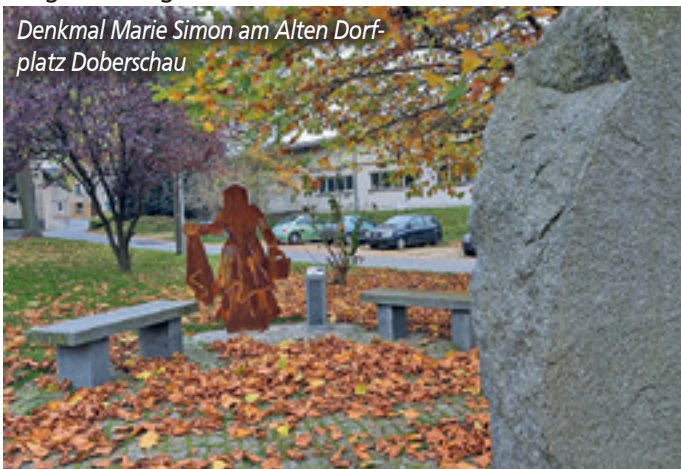
Denkmal Marie Simon am Alten Dorfplatz Doberschau

Danke an dieser Stelle all jenen stillen, unermüdlichen Helfern und Akteuren, die mithalfen, das ereignisreiche Jahr 2024 gut zu gestalten.