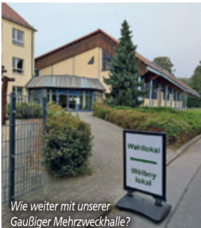
Wie weiter mit unserer Gaußiger Mehrzweckhalle?

Mit gebremster Euphorie widmeten wir uns einem nächsten Bundesprojekt, die Suche nach weiteren Fördermitteln für die Ertüchtigung unserer Sporthalle in Gaußig. 45% Förderung über den Bund wurden uns zugesagt und weitere Mittel konnten bis zum Eigenanteil von 10% für die Kommune