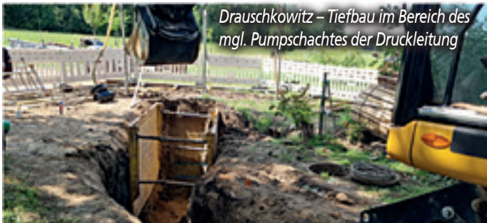
Drauschkowitz – Tiefbau im Bereich des mgl. Pumpschachtes der Druckleitung

ertragen alle, in Erwartung der später besseren und sichereren Verhältnisse. Ebenfalls in Diehmen im Mitteldorf konnte eine Maßnahme des Hochwasserschutzes mit dem Ersatz des Durchlasses und weiterer Sanierungsmaßnahmen am Gewässer (ca. 170.000 Euro) durch hundertprozentige Förderung des Freistaates abgeschlossen werden. Durch die Straßenbaumaßnahme mussten jedoch die weiter bachabwärts liegenden Projekte mangels fehlender Zugänglichkeit verschoben werden.