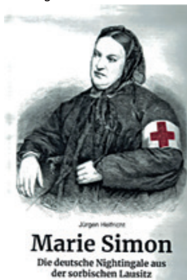
Vielleicht ein Weihnachtsgeschenk: Buch für 24,95 € ISBN: 978-3-948935-59-7

Im Bereich der Jugendarbeit gab es wieder aktive Gruppen, die zu schönen Gemeinschaftsprojekten führten. Der Jugendclub Gaußig konnte im Rahmen der 48 h Aktion eine Buchenhecke (700 Euro Zuschuss der Gemeinde) zur Verschönerung des Außenbereichs pflanzen. Die Valtenbergwichtel haben aktiv im Rahmen des Beteiligungsprojektes „Jugend bewegt Kommune“ Wünsche und Ideen gesammelt, die mit dem Preisgeld von 500 Euro und weiteren Aktionen Stück für Stück umgesetzt werden können. In einem weiteren Projekt im Rahmen der LEADER Förderung wurde die Entwicklung rund um das Außengelände der Sporthalle Schlungwitz mit 16.000 Euro vorangetrieben. Neue Räume für Volleyball und Dirtbiker sollen zu einer attraktiveren Nutzung beitragen. Bei dieser Umsetzung konnten wir auf eine Unterstützung durch von mehr als 50% Fördermittel über das LEADER Programm zurückgreifen.