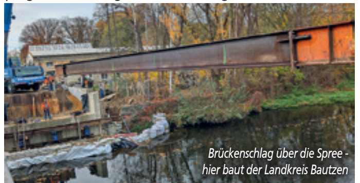
Brückenschlag über die Spree - hier baut der Landkreis Bautzen

Aber zum Glück gibt es auch ab und an positive Nachrichten. 2024 bekamen wir nach langer Antrags- und Planungsphase im Besonderen durch meine Mitarbeiterin Frau Burkhardt die Förderung aus dem Strukturwandelprogramm bestätigt. 90% Förderung für Baumaßnahmen