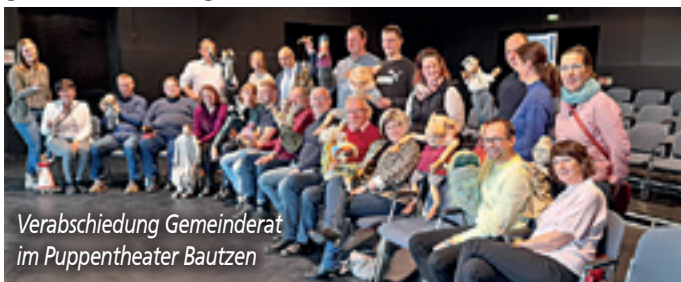
Verabschiedung Gemeinderat im Puppentheater Bautzen