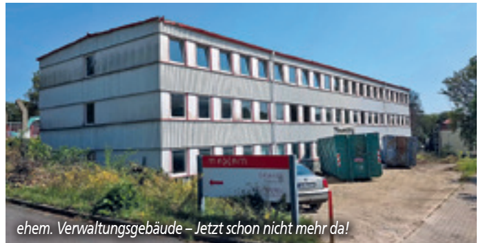
ehem. Verwaltungsgebäude – Jetzt schon nicht mehr da!

gesucht werden! Wir suchten akribisch und führten viele Gespräche mit Ministerien und Fördermittelgebern. Aber der „Teufel“ lag im Detail und hatte ganze Arbeit geleistet, sodass die vorgegebenen Rahmenbedingungen für uns nicht realisierbar und vor allem nicht finanzierbar blieben. Gefundene Landesfördermittel wurden von der Bundesförderung abgezogen, sodass unser Eigenanteil bei 45% verblieb. Darüber hinaus wurden die Auflagen des Bundes für einen geförderten Bau selbst, insbesondere in Hinsicht auf Umweltschutz, erhöht. Die Förderhöhe des Bundes selbst war aber bei Einreichung der Projektskizze zu benennen und kann nicht erhöht werden. Alles in allem ein zu großes Risiko für unsere Gemeinde, was der Gemeinderat notgedrungen durch eine Rückgabe von 1,8 Mio. Euro Fördermittel an den Bund quittieren musste! Keine Reaktion aus Berlin auf die Rückgabe zu dieser besonders umsetzungswürdig gefundenen Idee! Man könnte meinen, dass die Ampelregierung genau mit solchen Rückflüssen bzw. nicht abrufbaren Fördermitteln plane! Ein wahrlicher Tiefpunkt für mich und uns als Gemeinde in 2024!