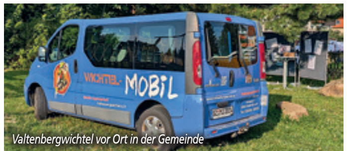
Valtenbergwichtel vor Ort in der Gemeinde

Herr Rupprecht meldete für seinen Wirkungsbereich Sport und Soziales wieder gute Ideen und Maßnahmen, die wir mitbegleiten konnten. Neben der Vereinsförderung konnten weitere konkrete Projekte realisiert werden. Nach der Umrüstung der Flutlichtanlage in Gaußig konnte auch in Doberschau die Umrüstung auf modernere LED- Beleuchtung noch rechtzeitig vor Beginn der dunklen Jahreszeit abgeschlossen werden. Die Kosten in Gaußig betragen 24.000 Euro und in Doberschau 47.000 Euro. Finanziert wurden diese hohen Investitionen zu 40 % über die Sächsisches Aufbaubank, 40 % ZUG (Bund), 10 % durch SV Gaußig und SV Gnaschwitz-Doberschau sowie 10 % aus der Gemeindekasse. Insbesondere in Doberschau musste leider viel Bürokratie überwunden werden, damit die ganze Maßnahme inklusive der zu erneuernden Masten letztlich in zugesagter Höhe gefördert wurde.