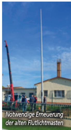
Notwendige Erneuerung der alten Flutlichtmasten

Auch weitere wichtige Meilensteine für 2024 können wir dokumentieren. Neben der Bestellung einer ständigen Vertretung der Leiterin konnten Mitarbeiter zu Praxisanleitern qualifiziert werden. Die Einführung eines Kinderschutzkonzeptes und die Errichtung neuer Außenspielgeräte wurden angeschoben und können nun weiter verfolgt und umgesetzt werden.