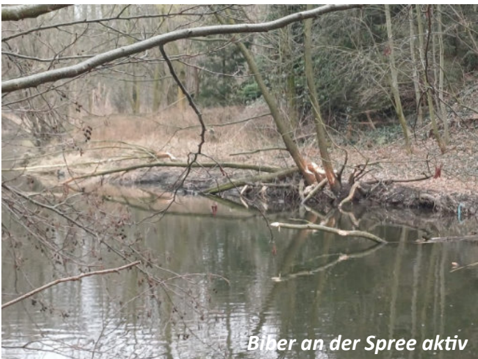
Biber an der Spree aktiv

Die Maßnahmen dienen einem optimalen Hochwasserschutz der Bevölkerung!