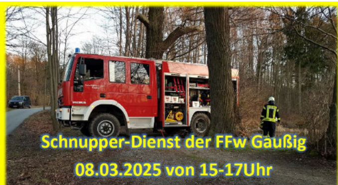
Schnupper-Dienst der FFW Gaußig 08.03.2025 von 15-17Uhr